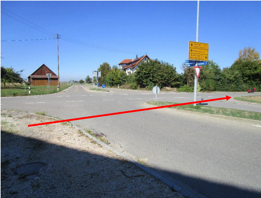
Gefahrenstelle 2: Überquerung Falkenhofstraße

⚠ Eine besondere Gefahr besteht für die Schüler/innen, die in der Sankt-Ursula-Straße oder der Falkenhofstraße wohnen und dann die Falkenhofstraße überqueren müssen. Auf dieser Straße fahren die Autos sehr schnell und die Stelle ist außerdem sehr unübersichtlich.